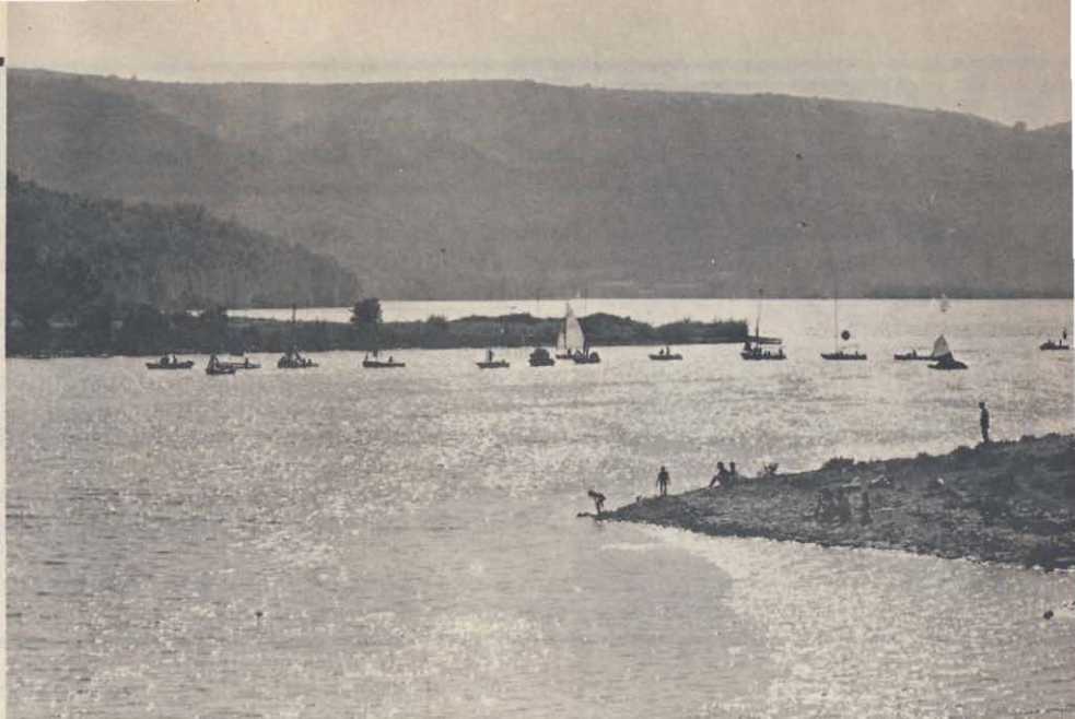
La Photographie Documentaire

près dans un sens, vent arrière dans l'autre, et la pêche bien sûr, à condition d'être patient.