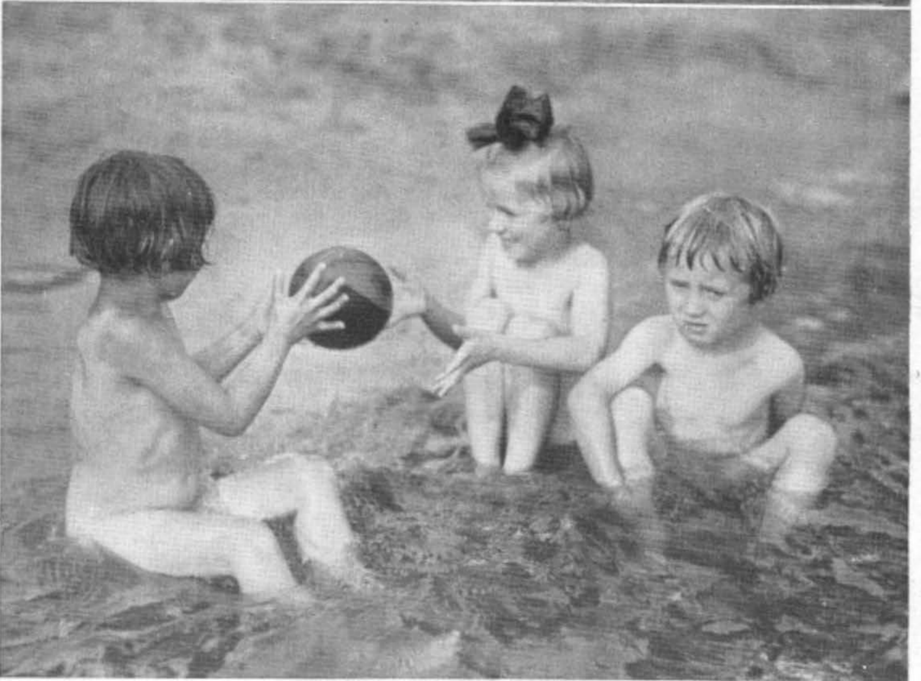
Oben: Bewegungsstudie Unten: Die Kleinsten