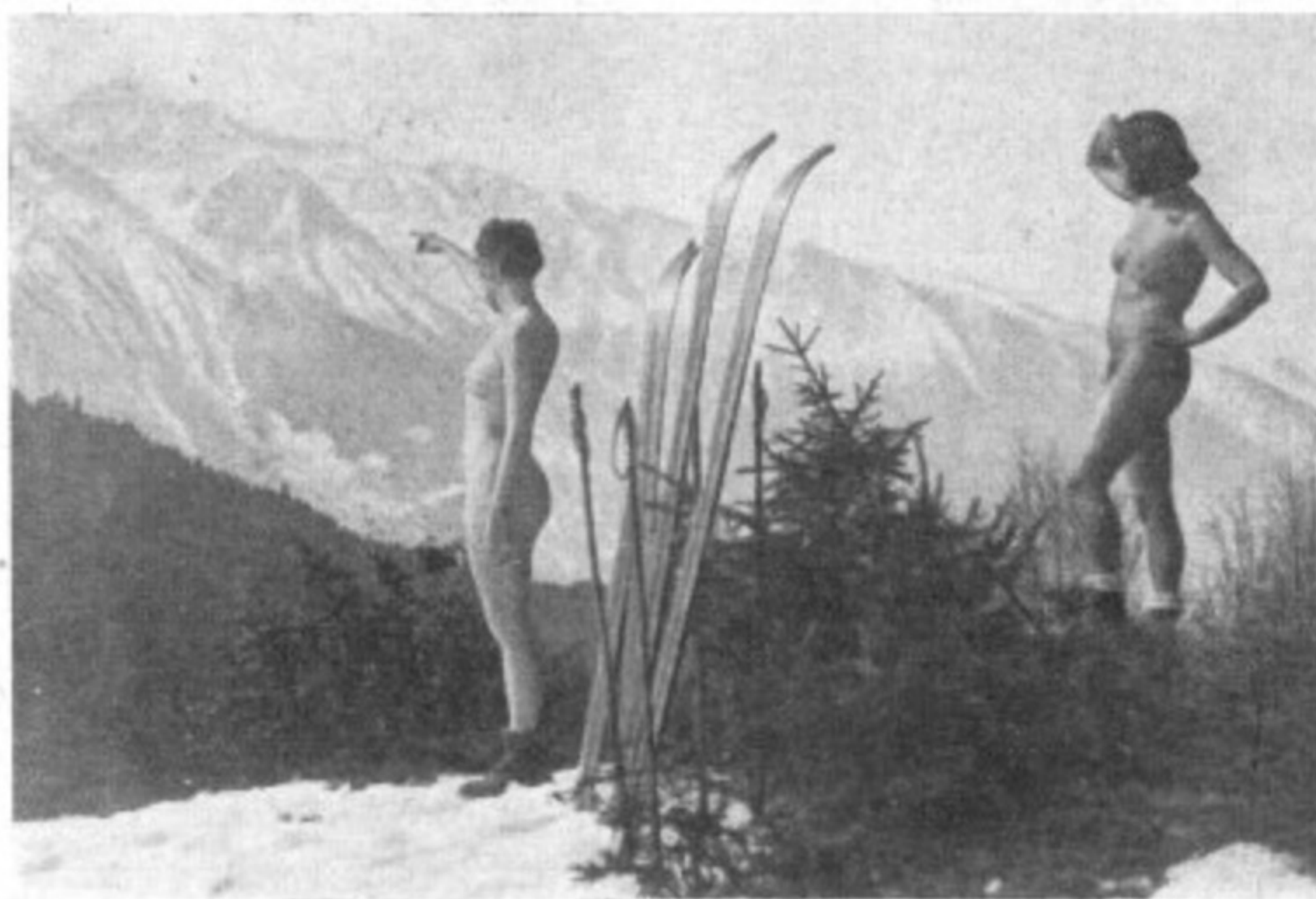
Auf sonniger Skifahrt

gegenüber und ebenso scheu schleicht er an den Problemen des Geschlechtslebens vorüber — oder (was in der Wirkung dasselbe ist) — er tanzt um diese Dinge herum. Die Zahnräder der körper-seelischen Mechanik greifen nicht mehr ineinander. Das große Herzzrad steht still und darüber und darunter bewegen sich ohne Verbindung miteinander, und da das Mittelrad still steht, erst nach heftigen Anstößen. Sexus und Hirn. — Hieraus resultiert auch die Einstellung zum nackten Menschen. Das Nackte schwebt als Zerrbild zwischen der dumpfbrodelnden Tiefe der Sexualität und einem vergeistigten unkörperlichen Niveau.