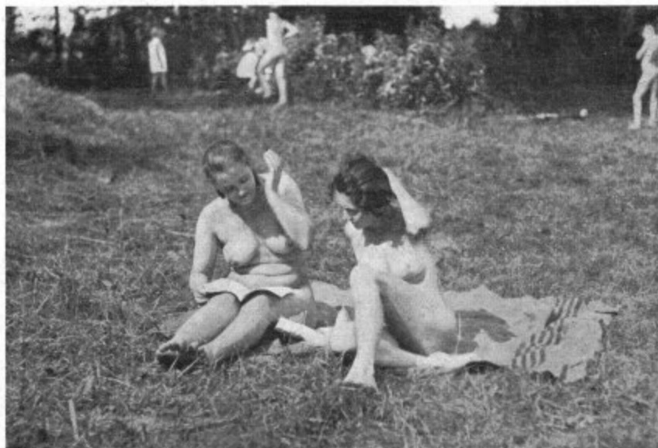
Sie lesen gemeinsam Freikörperkultur und Lebensreform

Ein wirklich neues Buch, nicht Sport, nicht Gymnastik, sondern natürliches Turnen. Man gewinnt Einblick in die Freiheit der Bewegungen, so wie sie bei den Tieren in natürlichster Weise vorhanden sind.