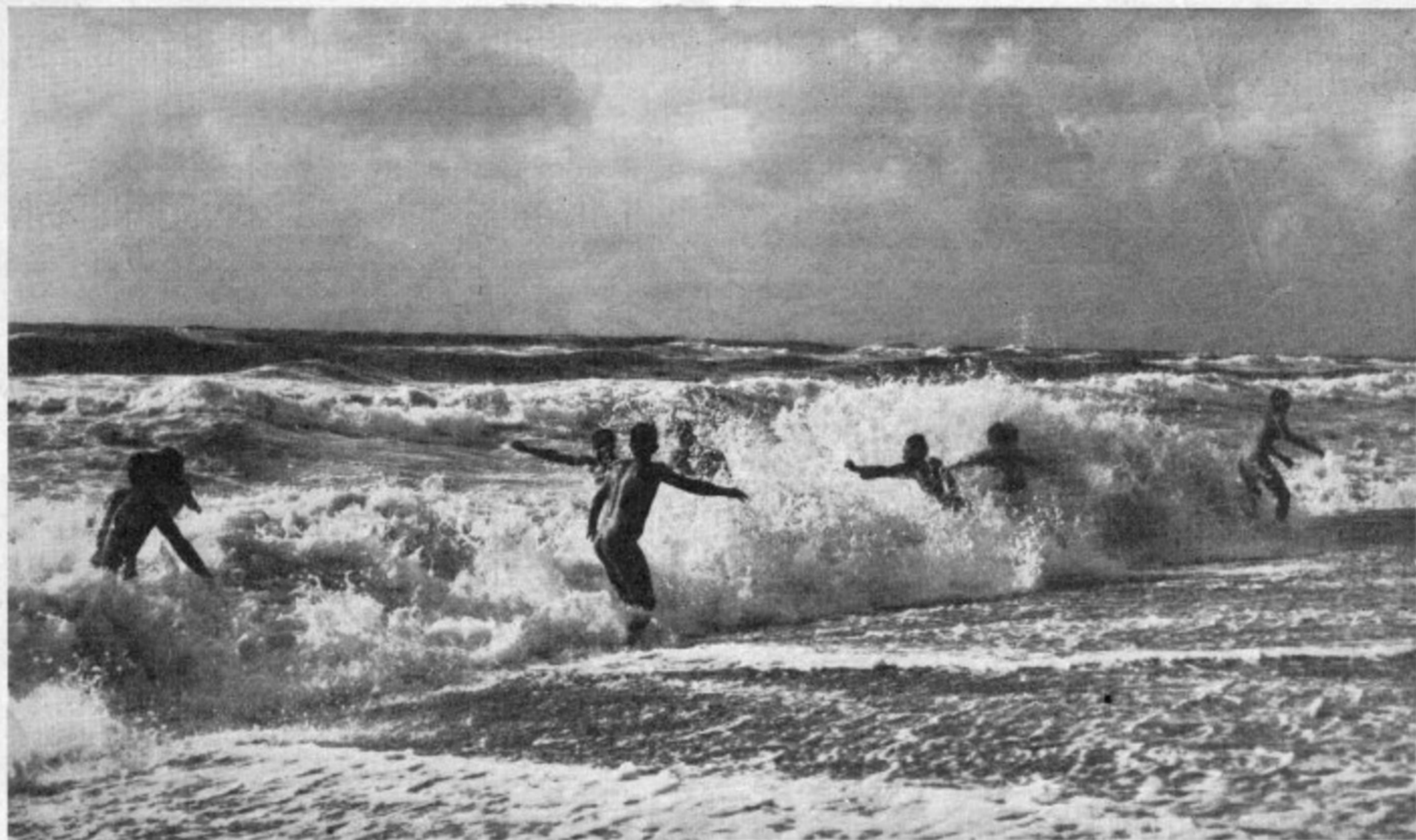
Badende in der Brandung