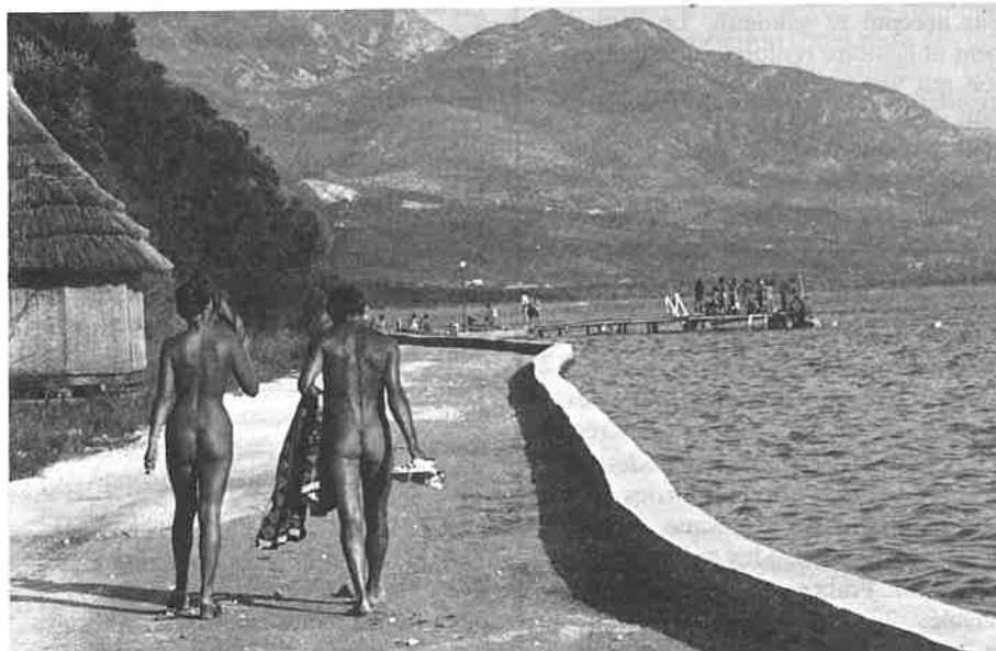
En bord de mer à Sveti-Marko.