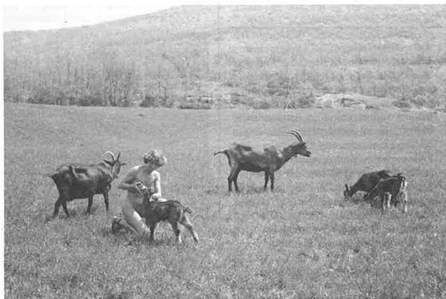
Et toujours sous un ciel bleu c'est la Haute-Provence...

Mais peut-être n'est-ce pas suffisant, alors pour 1980, une association assurera l'accueil et l'animation, mais attention, n'attendez plus que l'on vous prenne en charge, faites le vous-même.