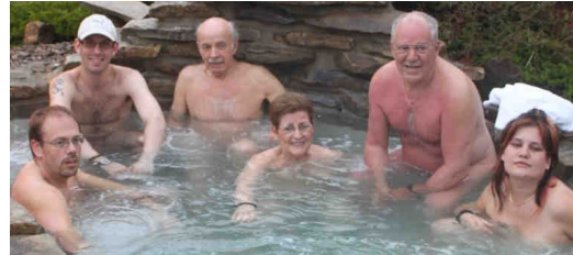
Spa nordique « sous les étoiles », à Québec

À ma connaissance, d'ailleurs, le GNQ a été le premier groupe à organiser un spa naturiste à Québec. Nous en sommes très fiers.