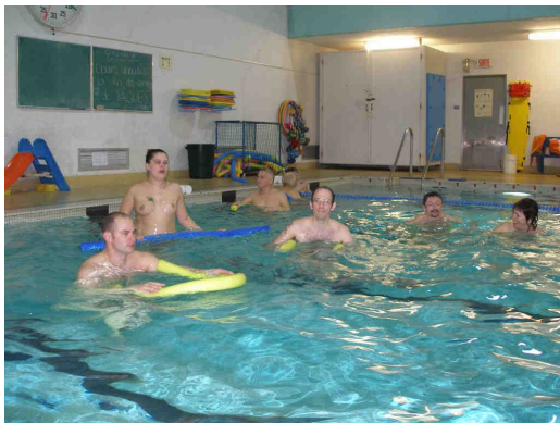
Séance d'aquaforme à la piscine naturaliste, à Québec

Le Groupe Naturaliste de Québec a des fondements qui remontent à 2001-2002. Né d'une volonté de regrouper des naturalistes de Québec, afin de faire revivre l'activité de piscine intérieure durant les mois d'hiver, j'ai lancé l'idée de ce regroupement dans le site Web de la Fédération québécoise de naturisme (FQN), avec la collaboration de son président d'alors. Fort de l'intérêt croissant de plusieurs naturalistes de Québec, j'ai effectué une démarche auprès du YWCA de Québec, pour louer sa piscine, mais en vain.