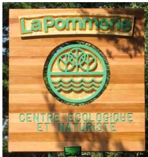
Entrée de La Pommerie, à Saint-Antoine-Abbé

Nous prévoyons suggérer quelques sorties d'une journée à la plage de Cap-aux-Oies, dans Charlevoix, ainsi que des excursions dans certains centres naturistes.