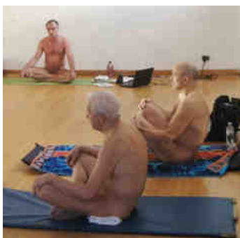
Séance de yoga nu à Québec

A travers les époques, plusieurs courants se sont développés et nous trouvons différents types de yoga, dont chacun a un but et des caractéristiques particulières : Hatha Yoga, Raja Yoga, Bhakti Yoga, Karma Yoga, Viniyoga. En Occident, les plus connus sont le Hatha Yoga et le Viniyoga.