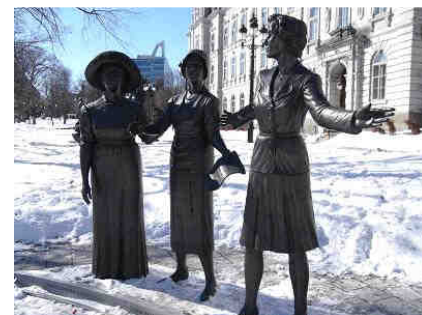
Le monument en hommage aux femmes en politique

Nous vous remercions, chères collègues, pour votre apport qui s'avère primordial pour notre avenir. A nos lectrices, sachez qu'il existe un comité des femmes au sein du Groupe naturiste de Québec. Si vous souhaitez joindre l'une ou l'autre des femmes responsables de ce comité, n'hésitez pas à leur écrire à l'adresse électronique apparaissant au babillard.