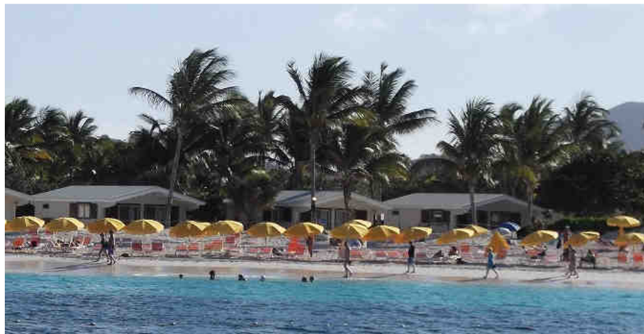
La superbe plage du Club Orient, sur la baie Orientale de Saint-Martin

Ceux et celles qui ont lu l'édition de l'automne dernier de Going Natural-Au naturel ou le numéro de septembre 2012 de Lis Nusité de Québec , se souviendront sans doute que j'ai eu la chance de remporter le grand prix offert par le réputé Club Orient, de Saint-Martin, dans le cadre du festival naturiste FQN-FCN, qui se tenait à La Pommerie, en août dernier.