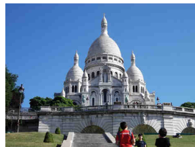
La basilique du Sacré-Cœur de Montmartre

En ce qui concerne les pickpockets , ils sont évidemment rusés et les touristes en sont prévenus, à l'aide d'affiches, près de tous les monuments importants. Il ne s'agit pas de tomber dans la paranoïa, mais plutôt d'adopter des attitudes et des comportements prudents : éviter les sacs à dos et les sacs à main (surtout ouverts); ne pas transporter trop d'argent liquide sur soi; éviter de sortir son portefeuille pour rien et de porter des bijoux. Je dois dire que je me suis senti en sécurité pratiquement partout durant mon séjour, même à Montmartre. Bien sûr, il faut éviter de prendre le métro à des heures indues. En effet, il y a des secteurs à éviter, dont le quartier de la Goutte d'Or, situé près de la Gare du Nord, que l'on qualifie de Bronx de Paris, ou, par exemple, la place Pigalle, tard le soir. De plus, aux abords de la basilique du Sacré-Cœur de Montmartre, de jeunes voyous cherchent à arnaquer les touristes et à les terroriser; la plupart étant des « sans-papiers » venus du Kenya. Il est impossible de se rendre à la basilique sans traverser leurs filets et je vous dirais qu'ils sont agressifs. À mon avis, les autorités ne devraient pas tolérer cela.