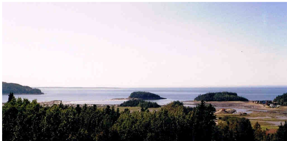
Le parc du Bic près de Rimouski

Petit à petit, la famille a pris racine. La petite tente a fait place à une tente-roulotte, à une roulotte hybride et, maintenant, à un grand véhicule récréatif et les Brayons ont quitté le sous-bois pour occuper un site bien en vue et fleuri avec amour, à l'entrée du camping, dans le « quartier brayon » (ils sont maintenant 11, du Nouveau-Brunswick, à être résidents saisonniers dans le seul centre naturiste à l'est de Québec).