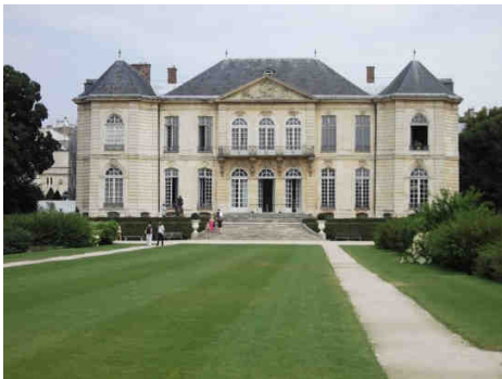
Le musée Rodin, vu du jardin

Que dire des innombrables musées? Le Louvre, le musée d'Orsay, le musée Rodin et bien d'autres encore qui possèdent des collections d'une grande richesse et savent comment les mettre en valeur. Je vous dirais que j'ai énormément apprécié mes visites dans les musées, mais mon coup de cœur va au musée Rodin, car j'adore la sculpture et les magnifiques jardins du musée représentent une oasis de paix, nous donnant l'impression d'être ailleurs.