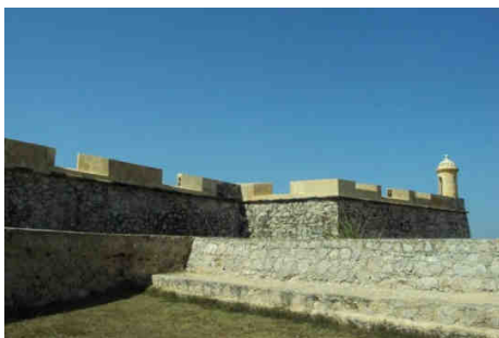
Le fort de San Carlos

Zapara est une île qui offre un caractère double: d'une part c'est un endroit lacustre, situé sur le lac de Maracaibo; d'autre part, c'est un environnement maritime puisqu'elle marque le début du golfe du Venezuela. C'est un joyau naturel dont l'accès est difficile, mais non impossible, mais à l'inverse facile pour l'individu déterminé et empreint de l'esprit d'aventure. En arrivant à Maracaibo, on doit se diriger vers le village de El Mojan situé à l'extérieur de la ville, mais en fait tout près. C'est à cet endroit que l'on trouve les quais où l'on prend les embarcations menant jusqu'aux îles du Lago de Maracaibo (lac de Maracaibo). Cette fois-ci, avant de nous diriger vers Zapara, nous avons décidé de visiter l'île de San Carlos, où se trouve une construction coloniale qui attire fortement les regards, connue comme le fort de San Carlos et qui a aussi déjà été une prison.