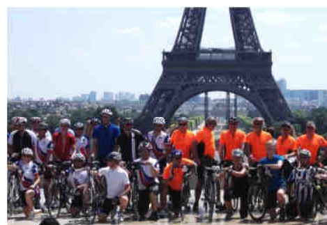
21 juillet 2013, jour de l'arrivée à Paris du 100 e Tour de France

Les Champs-Élysées sont aussi le lieu traditionnel d'arrivée de la dernière étape du Tour de France. En effet, lors de mon séjour, tout Paris vibrait au rythme de ce 100 e Tour de France, alors que l'on en attendait son dénouement, le dimanche, 21 juillet. Il régnait, à cet endroit, une réelle ambiance de fête.