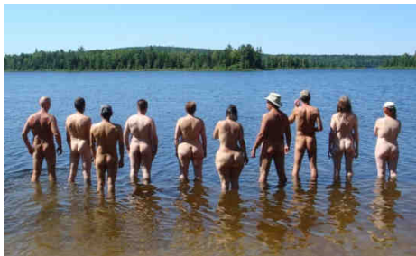
Tout nus à la baie des Onze Îles