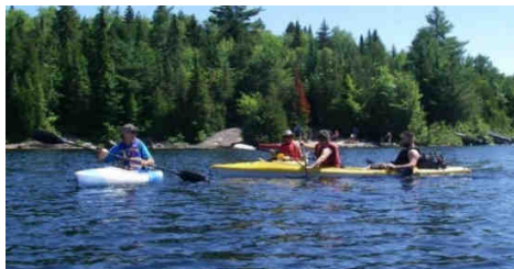
Sur le lac du Caribou

En y allant doucement, nous avons parcouru la distance vers les sites de camping sauvage réservés par notre organisateur en environ deux heures.