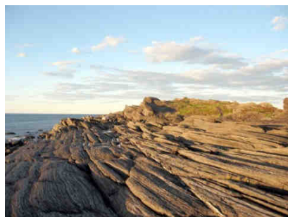
Superbe paysage de l'île Verte

Mais, il est un sujet sur lequel tous les membres de la famille ainsi que leurs amis québécois s'entendent à dénoncer : c'est l'association trop facile que les « textiles » font entre naturisme et échangisme, ce qui contribue à répandre l'idée fausse que le naturisme est une sorte de perversion. Pourtant, à voir cette famille et leurs amis partager leur nudité avec simplicité et naturel et en retirer tant de bien-être, on est à mille lieues de l'idée que la nudité partagée mène automatiquement à des pratiques sexuelles débridées.