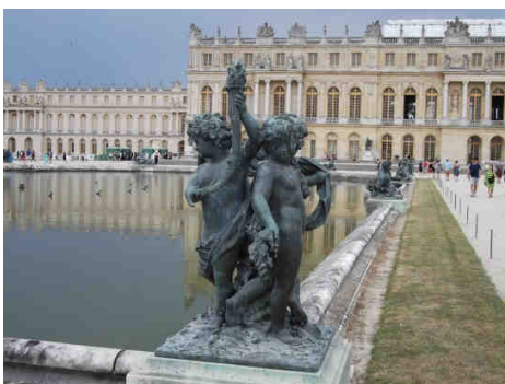
Le château de Versailles

D'autre part, on ne peut être à Paris sans aller faire un tour à Versailles, à une trentaine de minutes par train. Le château de Versailles a été le point culminant de ce voyage et m'a grandement impressionné. Classé depuis 30 ans au patrimoine mondial de l'humanité, le château de Versailles constitue l'une des plus belles réalisations de l'art français du XVII e siècle. L'ancien pavillon de chasse de Louis XIII fut transformé et agrandi par son fils, Louis XIV, qui y installa la Cour et le gouvernement de la France en 1682. Jusqu'à la Révolution française, les rois s'y sont succédés, embellissant chacun à leur tour le château.