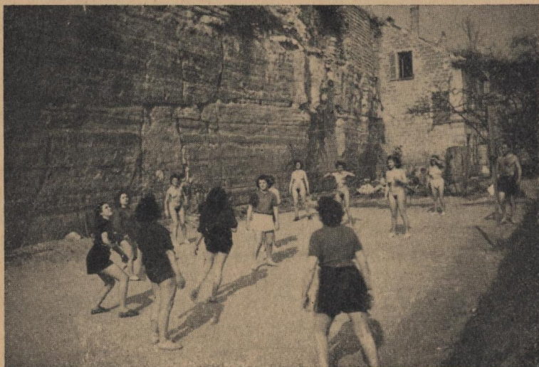
Das nebenstehende Bild zeigt die Damenmannschaft des „Club du Soleil“ beim Volleyballspiel gegen einen Pariser Klub