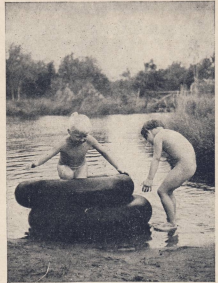
Camp de Hanovre : Un étang offre les plaisirs de la plage.

● Enfin, au Schlosswende, une « Exposition de la Libre-Culture en Images » était ouverte au public (entrée interdite aux mineurs). Très belle exposition de photos intégrales et d'œuvres de peintres, autorisée par les pouvoirs publics, et qui nous indiqua la mesure de ce qui pourrait être fait probablement à Paris.