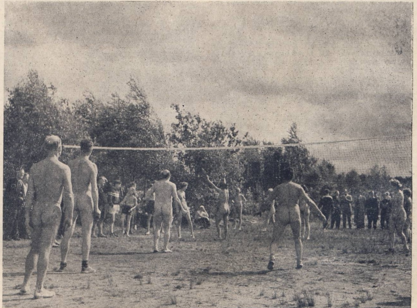
Camp de Hanovre : Match de volley-ball France-Belgique contre Berlin.

Dans les environs de la ville, des quartiers neufs ont surgi au milieu de la verdure. D'immenses étendues boisées entourent cette ville de 550.000 habitants. C'est là que les habitations nouvelles ont été édifiées, car le centre de la ville est occupé par des bureaux, des commerces, des administrations (Hanovre est la capitale de la Basse-Saxe et abrite par conséquent divers ministères). Les routes qui relient entre eux les divers quartiers d'habitations, la « Gartenstadt » ou ville des jardins, sont toutes conçues de manière à permettre un trafic très intense, non seulement en direction du centre de l'agglomération, mais aussi vers l'extérieur.