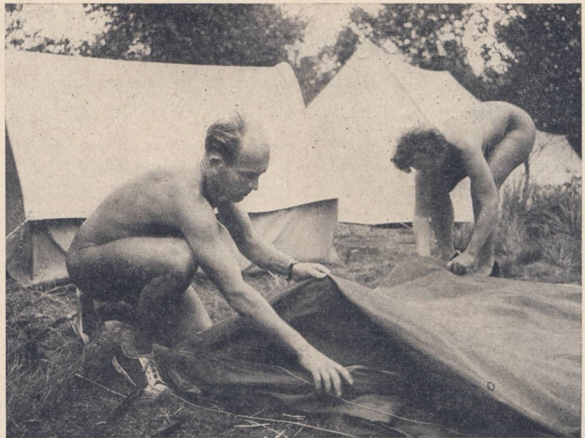
Camp de Hanovre. Dernier jour : des congressistes campeurs plient bagages.

Cette question étant laissée en suspens jusqu'à la reprise de la séance, d'autres